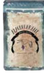
フレグランスソルト

その他、ボディケア関連もOEM承りますが、協力工場での製造となり、ロットも異なります。詳しくは営業までお問い合わせください。